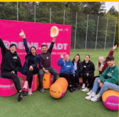
Ausbildungs-Event Move & Connect

Die städtischen Betriebsrestaurants, die auf regionale und frische Produkte großen Wert legen, sind beim Personal sehr beliebt und bieten ermäßigte Preise für Auszubildende und Studierende. Zudem erhalten alle Auszubildenden und Studierenden ein kostenfreies Deutschlandticket für den ÖPNV.