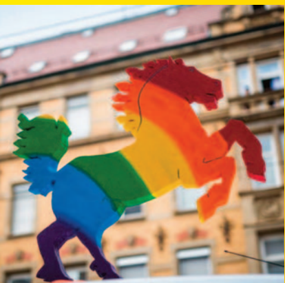
Das Stuttgarter Rössle