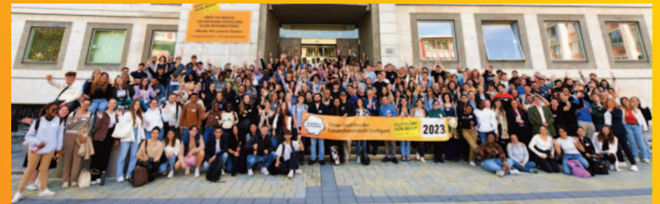
Begrüßung der neuen Auszubildenden und Studierenden 2023

Besonders wichtig ist der Stadt eine qualitativ hochwertige Ausbildung. Dies gelingt unter anderem durch regelmäßige Qualifizierungsmaßnahmen der Ausbildungsverantwortlichen, eine enge Zusammenarbeit mit den Hochschulen bzw. Berufsschulen, intensive Prüfungsvorbereitung, hausinternen zusätzlichen Unterricht und bei Bedarf Unterstützungsangebote. Die Stadt vermittelt auch Zimmer für Auszubildende und Studierende.